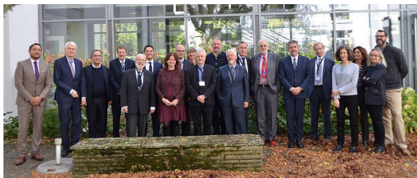
Αναμνηστική φωτογραφία των συνέδρων. Τέταρτος από αριστερά στην πρώτη σειρά διακρίνεται ο Πρόεδρος της Ελλ. Εταιρείας Εγκληματολογίας, Καθηγητής Νέστωρ Κουράκης.

Το workshop, το οποίο στέφθηκε με επιτυχία, έκλεισε με τις τελικές παρατηρήσεις της επιστημονικής επιτροπής και την προαναγγελία της έκδοσης του αντίστοιχου συλλογικού τόμου εντός του 2020.